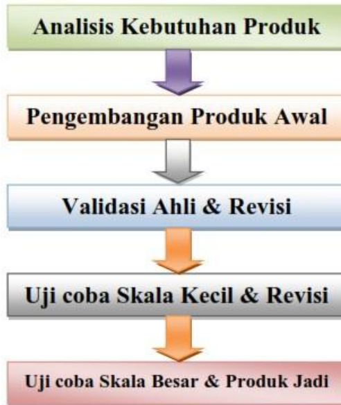
Gambar 2. Desain model 5 langkah Puslitjaknov

Desain model puslitjaknov tahun 2008, dikembangkan oleh tim yang bekerja pada pusat penelitian dan pengembangan kebijakan kementerian pendidikan dan kebudayaan yang dahulu kala dikenal dengan Departemen Pendidikan Nasional. Desain model ini berawal dari langkah/tahapan penelitian dan pengembangan Borg & Gall yang telah disederhanakan. Berikut langkah atau tahapan dari desain model 5 langkah/tahapan puslitjaknov.